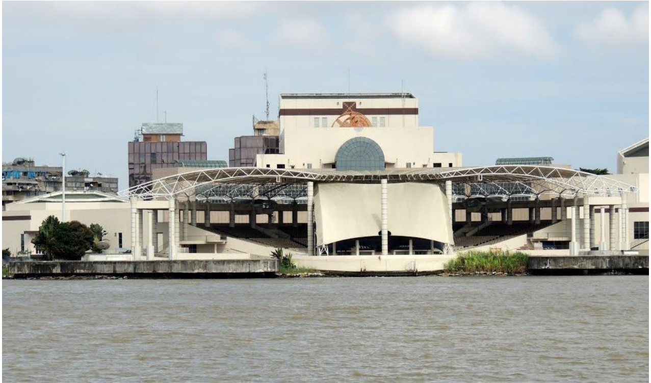
Le Palais de la Culture d'Abidjan.