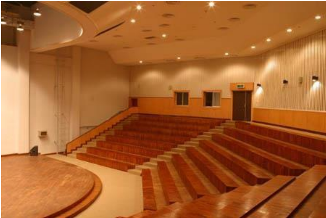
Vue de la salle