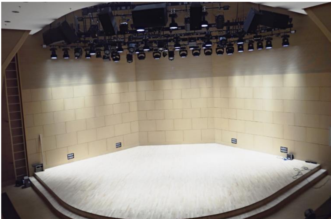
Vue de la scène