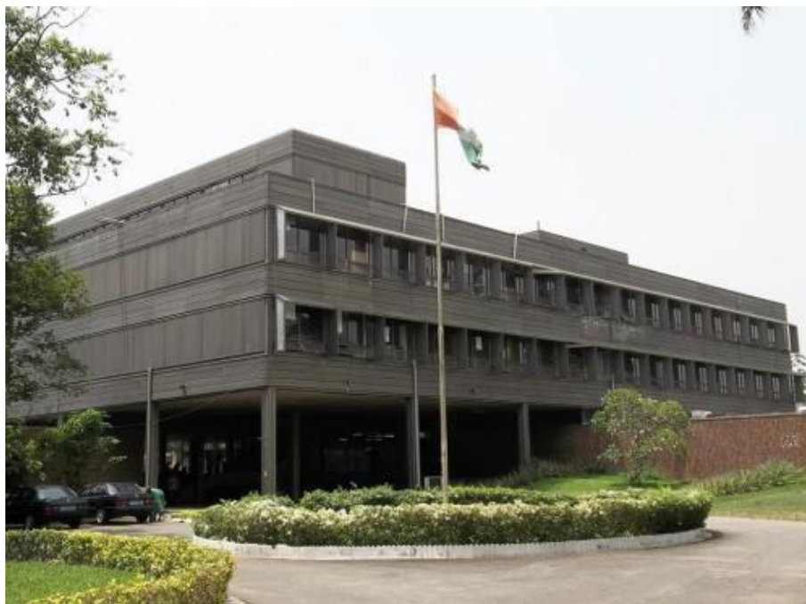
Vue extérieure de la Bibliothèque nationale de Côte d'Ivoire.

La Bibliothèque nationale de Côte d'Ivoire , construite sur la base des plans dressés par les architectes canadiens MM. Longpré, Marchand et associés, a été inaugurée le 9 janvier 1974. Elle se situe sur un terrain de 1,2 ha avec plus de 6 500 m 2 de planchers.